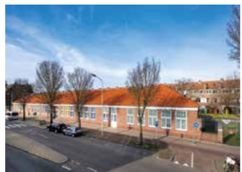
De Malle Mok